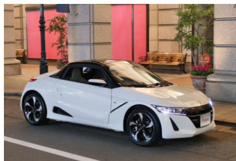
CFRP ROOF を装着した Honda S660