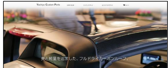
サイトのトップイメージ

2019年6月27日（木）12:00 から、 上記サイトで予約受け付けを開始します。