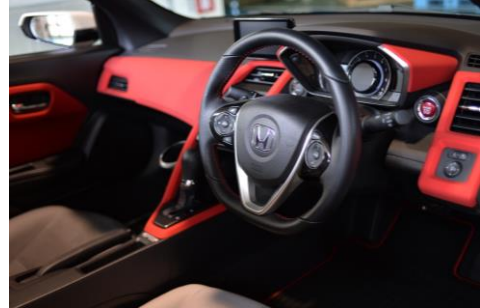
Yachiyo Styling Parts for Honda S660 (S660 カスタマイズパーツ)