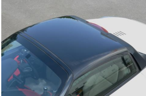
軽量カーボンルーフ